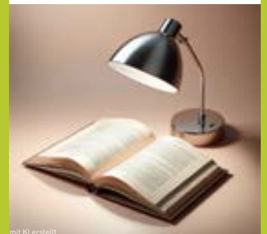
mit KI erstellt

Nachfolgend ein paar spannende Lektüren zum Thema Klimakrise: