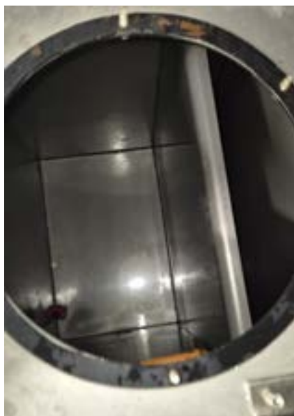
Fermanox-Anlage vor und nach der Reinigung